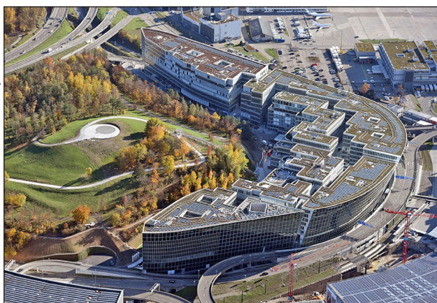
THE CIRCLE na letišti Zürich, Švýcarsko, 2020