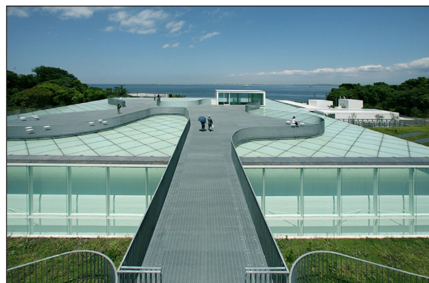
Yokosuka Museum of Art, Yokosuka, Japonsko, 2006