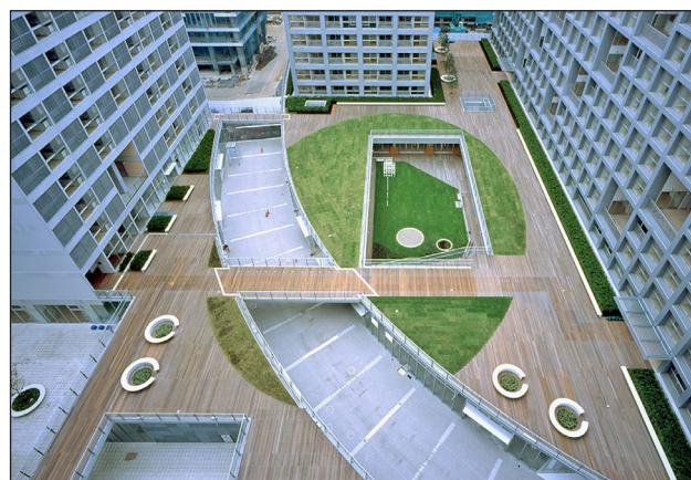
Shinonome Canal Court CODAN, Tokio, Japonsko, 2003