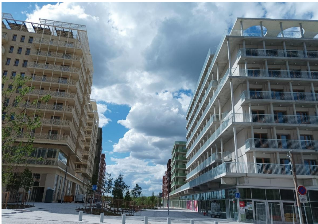
Obr. 2: Olympijská dedina [archív autora]

V olympijskej dedine sú objekty navrhnuté s ohľadom na princípy bioklimatického dizajnu, napríklad objekty sú orientované kolmo na tok rieky Seiny, čo zabezpečuje prúdenie vzduchu, plánuje sa recyklácia odpadovej vody a moču pomocou oddelených toaliet, ktoré budú transformované na poľnohospodárske hnojivo. Tepelný komfort vo vnútri budov je zabezpečený nielen dizajnom drevených rámových fasád, ale aj solárnymi panelmi umiestnenými mimo fasád. Objekty sú vykurované geotermálnou energiou a teda aj schopné chladenia. Sú pripravené na zvyšovanie teploty, ktoré sa očakávajú v Paríži do roku 2050, kedy bude teplota rovnaká ako dnes v Seville [12]. Prostredníctvom fotovoltaických zariadení, bude zabezpečená energia pre 700 domácností. Pribudla nová vnútromestská zeleň ako nové parky a klimatické záhrady a aj nové mestské lesy, časť z nich umožňuje gravitačnú úpravu vody. Zeleno-modré opatrenia podporujú miestnu biodiverzitu. Strechy budov sú prispôsobené pre migráciu vtákov a do fasád sú integrované hniezda pre vtáky [12]. Bola zabezpečená ochrana 2 800 voľne žijúcich druhov zvierat a rastlín v meste, ktoré sú nevyhnutné pre ekosystém mesta. Boli rozšírené a zrekonštruované aj mestské záhrady [11].