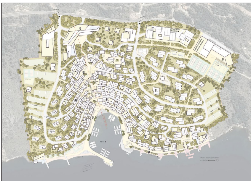
MIRIS GARDEN (Lukáš Mottl, Jan Vařečka)

Projekt přestavby Rajské zahrady je příkladem moderního městského plánování, v němž se prolínají zásady současného designu se stávající městskou strukturou. Návrh vyniká integrací konceptu 15minutového města, který zajišťuje dostupnost služeb a občanské vybavenosti v krátkém dojezdovém čase, a podporuje tak propojené městské uspořádání. Podporuje udržitelný rozvoj tím, že upřednostňuje infrastrukturu pro pěší a cyklisty, snižuje závislost na automobilech a snižuje emise uhlíku. Tento přístup je v souladu s Novou městskou agendou a podporuje rovný