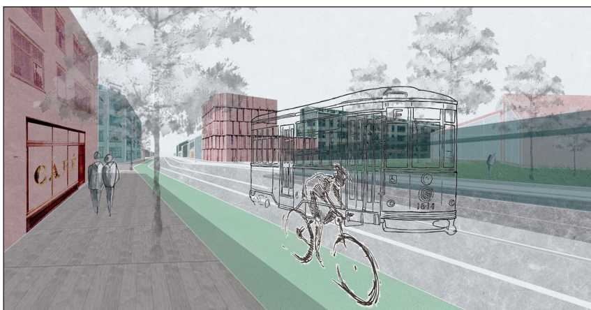
From Worker's Village to Hick Town (Gergely Bence Bodnár, Bálint Bíró)

Po důkladné analýze území projekt identifikuje možnosti transformace veřejných prostranství a interiéru rozvojových bloků, a to řadou převážně drobných zásahů. Nejprve navrhuje rámcový plán rozvoje