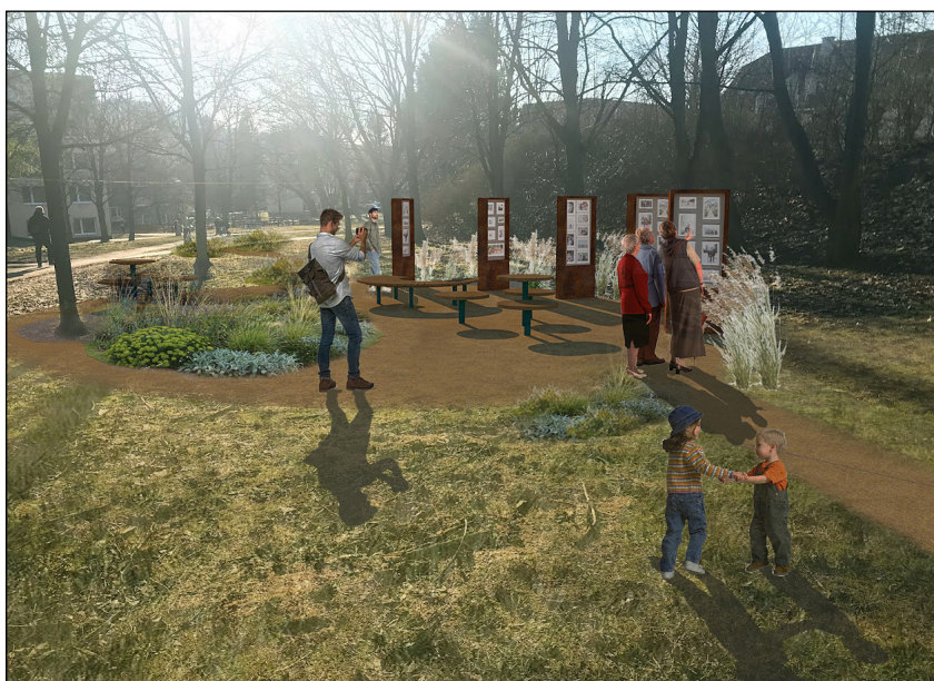
Vizualizace komunitní galerie Pruh