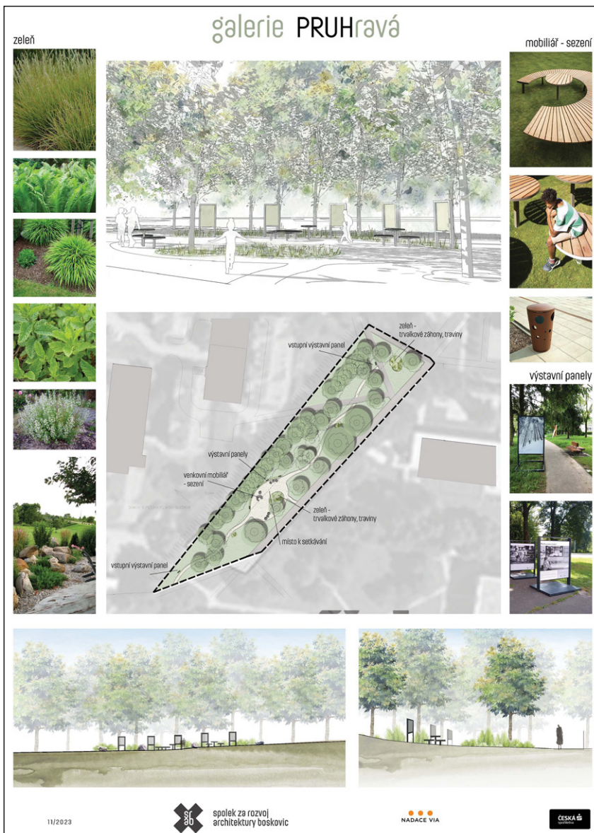
Návrh komunitní galerie Pruh