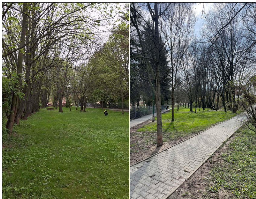
Původní stav parku

Jak vlastně takové plánování s veřejností neboli participace probíhá? Grantový program počítá se dvěma plánovacími setkáními. Na tom prvním, které může být doplněno i anketou, místní lidé diskutují o hodnotách, problémech a potenciálu řešené plochy. Jinými slovy o tom, co lidé na prostoru oceňují, co jim naopak vadí a také o tom, jaké aktivity by v prostoru měly v budoucnu probíhat. V případě boskovického Pruhu se ukázalo, že místní lidé si velmi přejí zachování zeleně, ale hlavně klidového charakteru místa. Chtěli by také zvýšit bezpečnost místa. Někteří obyvatelé měli obavy z hluku a z přítomnosti mladých lidí nebo lidí bez domova, kteří se pohybují v blízkosti vlakového a autobusového nádraží. Účastníci prvního plánovacího setkání vyjádřili také obavy o údržbu parkové plochy. Vzhledem k tomu, že celý projekt má záštitu města Boskovice, které přislíbilo pomoc s jeho realizací, podařilo se týmu obavy z nedostatečné údržby rozptýlit. Složitějším tématem se ukázalo být zachování klidového charakteru místa.