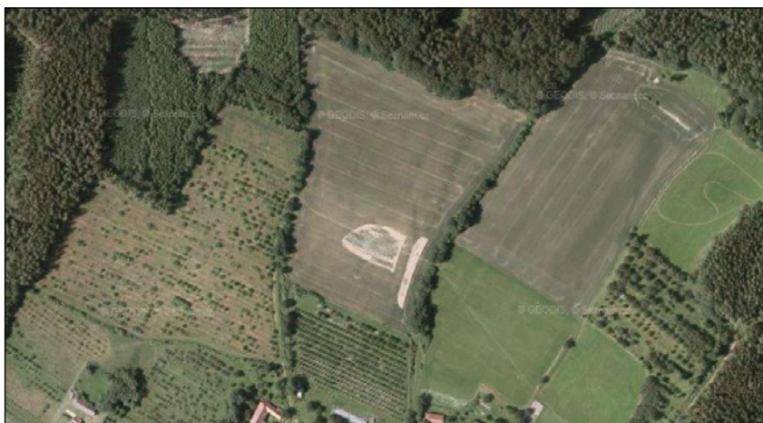
Podhorní Újezd a Vojice 2010–2012

Jedná se především o vliv některých staveb na krajinu. Zajímavé je také porovnání základních struktur, jak byly vymezeny ve studiích, které vznikly v navazujících územích či v jiných měřítkách a zasahují i naše území. Přířnos studie pro území je značný. Bohužel její potenciál není dostatečně využit. Externí zpracování umožnilo získat velké množství dat umožňující daleko preciznější zpracování nezastavěného území ve vznikajících územních plánech. Bohužel „praktické“ využití územních plánů je z pohledu obcí zaměřeno především na zastavě-