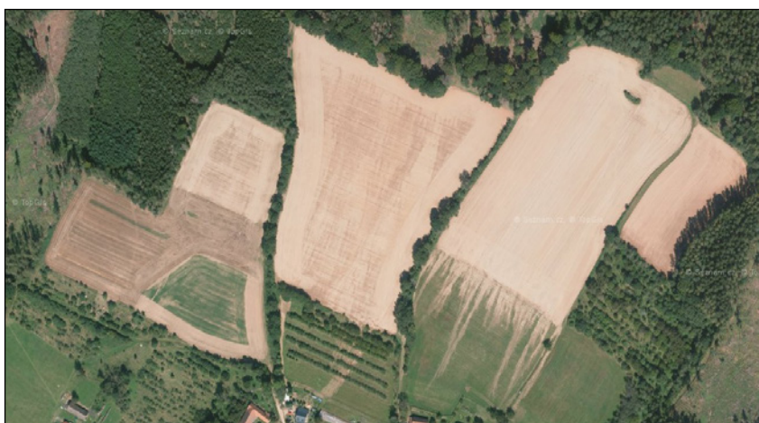
Podhorní Újezd a Vojice 2019–2021